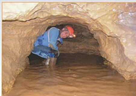
Passage dans la rivière sous le 2 ème éboulis

Le développement de la cavité (longueur totale des galeries topographiées) atteint aujourd'hui 1182 mètres.