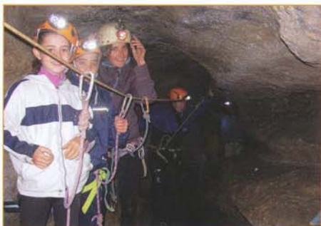
Passage en corniche au-dessus de la rivière lors d'une visite découverte

On retrouve pourtant la grotte d'Orchaise dans l'histoire dès le V e siècle : selon Sulpice Sévère, Saint Martin aurait accompli, près de la grotte un des plus fameux miracles.